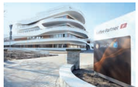
Kaffee Partner GmbH, Osnabrück

Der mehrstöckig terrassenförmig angelegte Verwaltungsbau fällt bereits von Weitem auf. Auf 5.000 m 2 Fläche bietet das Gebäude für die rund 400 Mitarbeiter eine helle, transparente Raumgestaltung, geprägt durch warme Farben, weiche Formen, individuelle Beleuchtung und optimale Akustik.