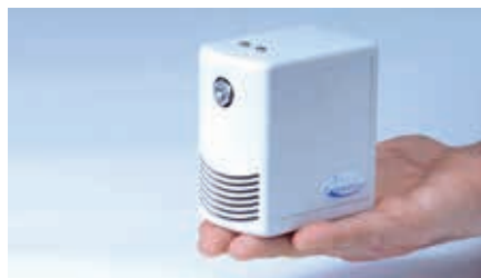
DRAABE NanoFog Evolution: passt in jedes Gebäude