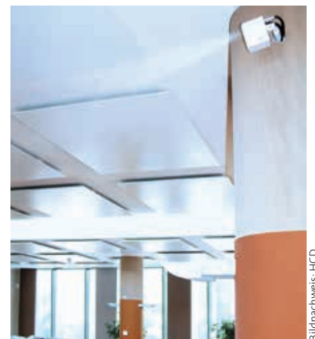
Nahezu unsichtbar: kleine DRAABE NanoFog Vernebler sorgen für eine optimale Luftfeuchtigkeit