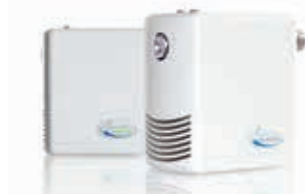
Vier Vernebler der Serie „DRAABE NanoFog Evolution“ sichern ganzjährig eine optimale Luftfeuchtigkeit im neuen JURA-Gebäude

tausch der Wasseraufbereitungseinheit und dem Check des gesamten Systems garantiert Condair Systems einen störungsfreien und hygienisch sicheren Einsatz der DRAABE Luftbefeuchtungsanlage. Für JURA als Anwender ist das System daher wartungsfrei.