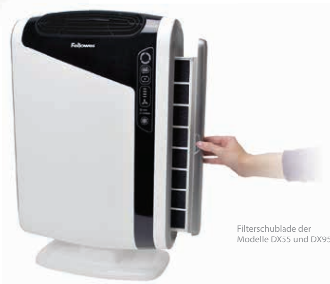
Filterschublade der Modelle DX55 und DX95

Zur effektiven Reinigung der Luft sollte der Kohlefilter bei normaler Nutzung ca. alle 3 Monate und der True HEPA Filter alle 12 Monate ersetzt werden.