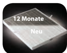
True HEPA Filter

Bei den Modellen DX55/DX95 lassen sich die Filter seitlich herausziehen und einfach und schnell austauschen. Bei Modell DX5 wird zum Filterwechsel die Rückblende abgenommen.